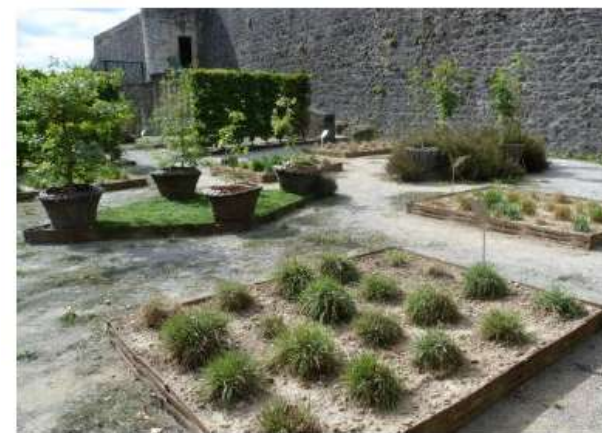
Pollinarium sentinelle de Limoges

≠ mais complémentaire de la surveillance dans l'air ambiant (RNSA) et du risque sanitaire associé (indice RAEP)