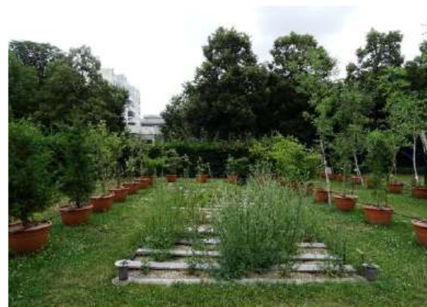
Pollinarium sentinelle d'Angers